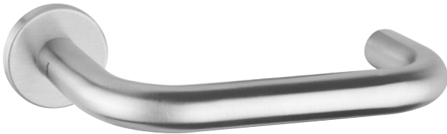
Illustration avec rosace 5620C