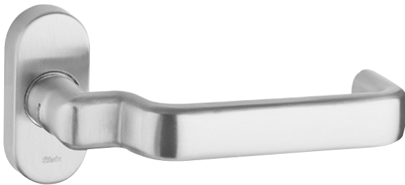
Abbildung mit Rosette 5618C