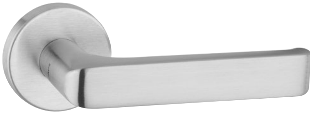
Abbildung mit Rosette 5620C