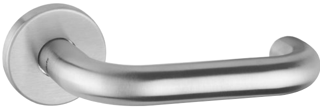
Abbildung mit Rosette 5620C