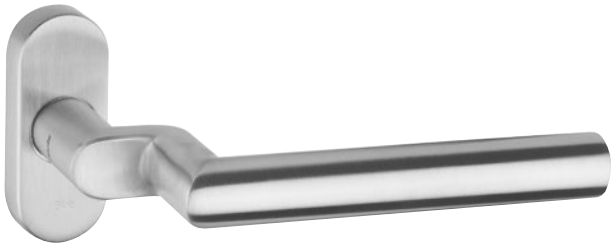
Abbildung mit Rosette 5618C